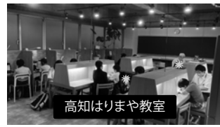
高知はりまや教室